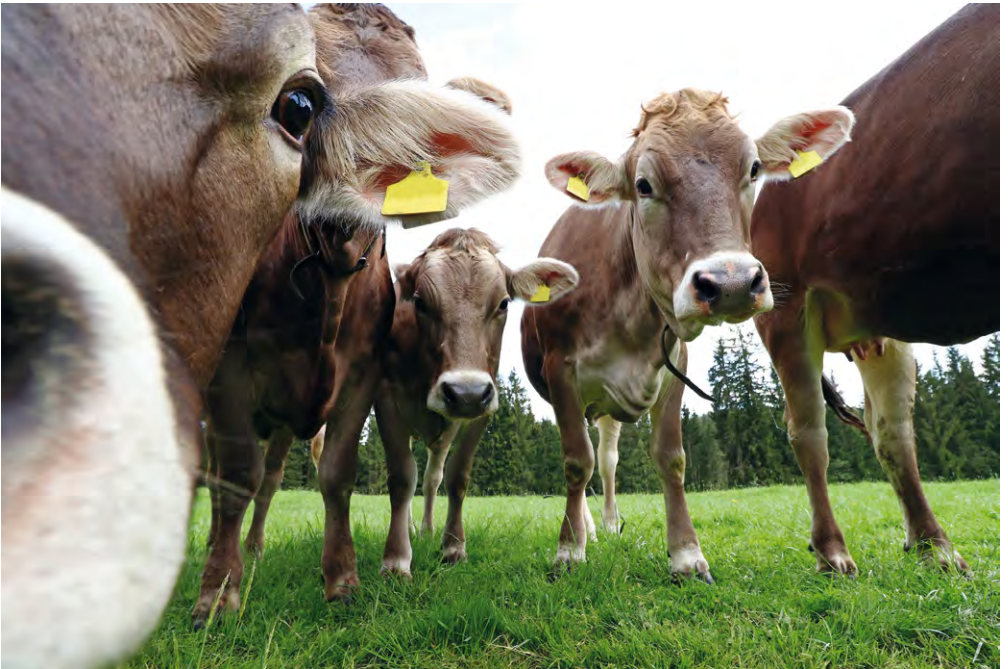
Salopp gesagt: eine Biovergärungsanlage ist auch nur eine Kuh.