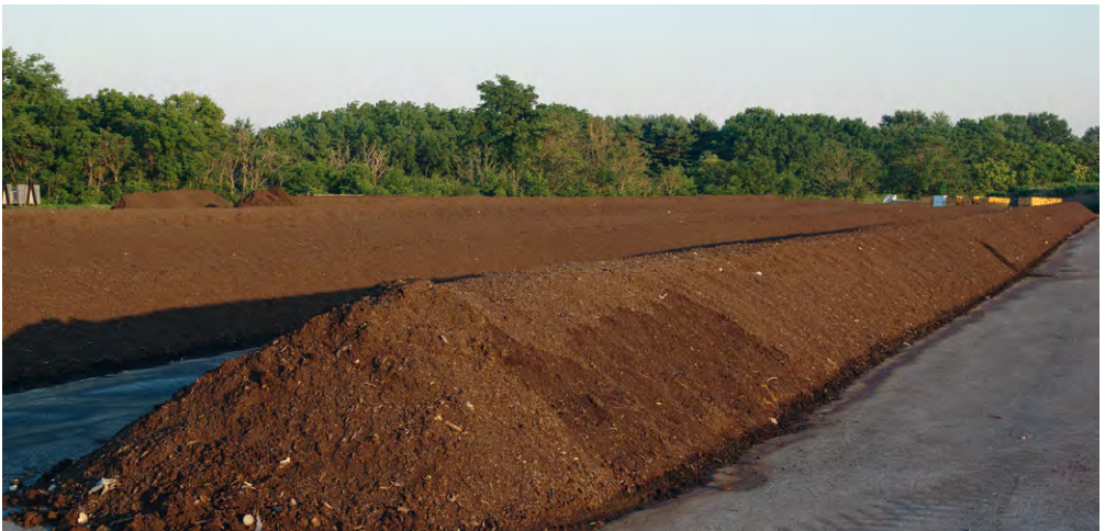
Sogenannte Mieten oder Haufwerke.

Im mittleren Teil dieser Broschüre finden Sie eine Liste der Stoffe (Trennliste), die über die Biotonne im Landkreis München gesammelt werden sollen. Daneben finden sich die Stoffe, die nichts in einer Bioabfalltonne zu suchen haben – und zwar aus guten Gründen.