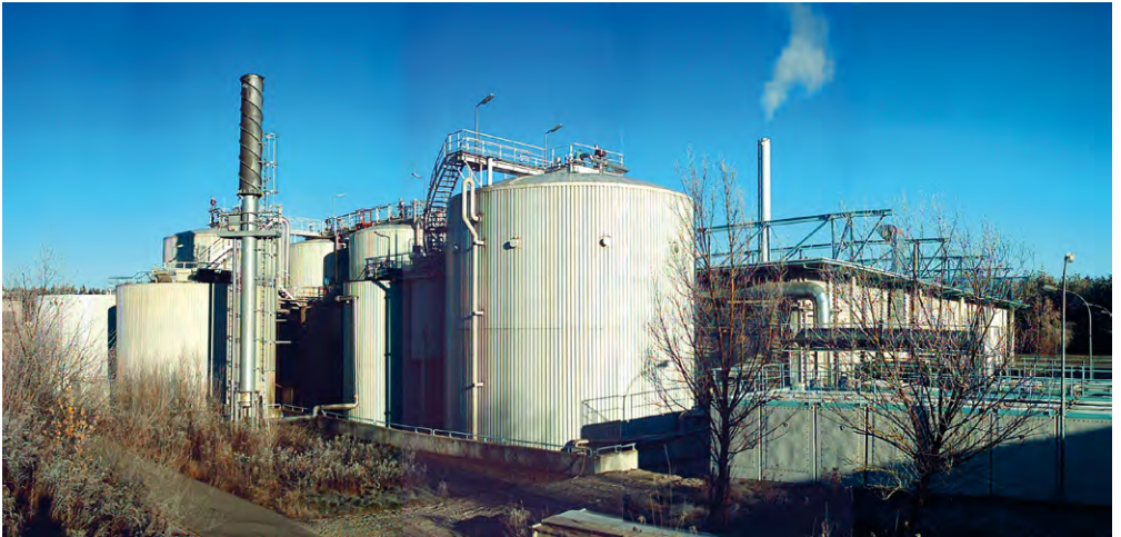
Die Biovergärungsanlage in Brunthal-Kirchstockach.